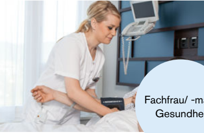
Fachfrau/ -mann Gesundheit