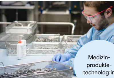
Medizin- produkte- technolog:in